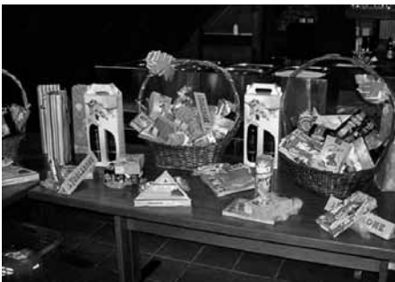
Der Gabentempel – auch 2011 mit dem Prädikat «Weltklasse»!