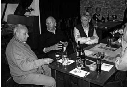
Die besten «Undenufe-Obenabe»-Strategien wurden festgelegt.