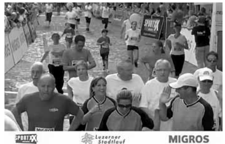
Ein wahrer Fotofinish – selbst der Zielfilm zeigte ein ex-aequo.