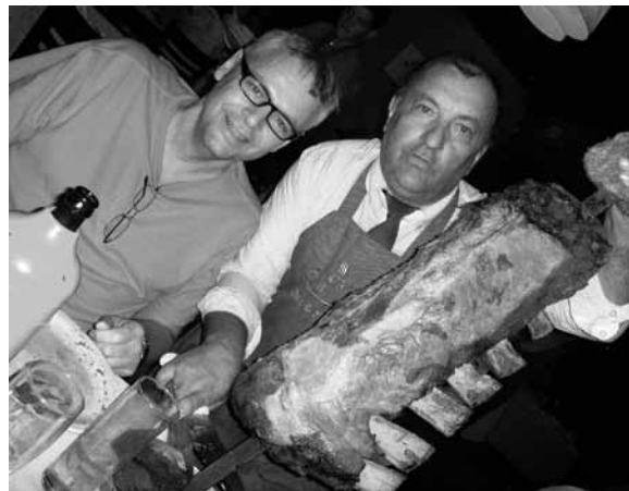
Einem guten Bissen nicht abgeneigt, hier in einer Churrascaria in Brasilien.