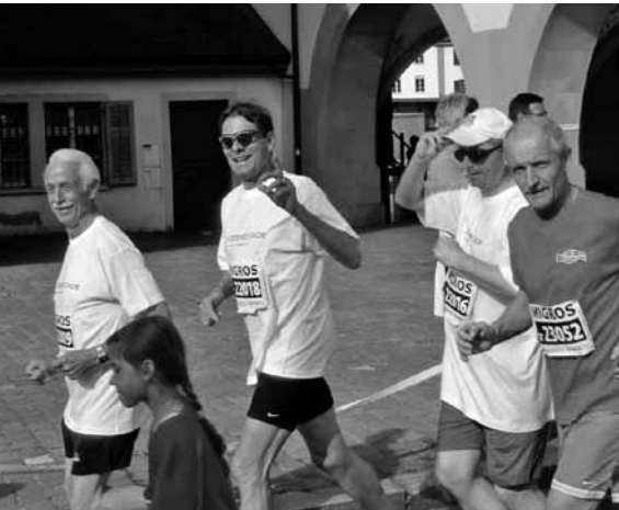
Lauf mit Lächeln...