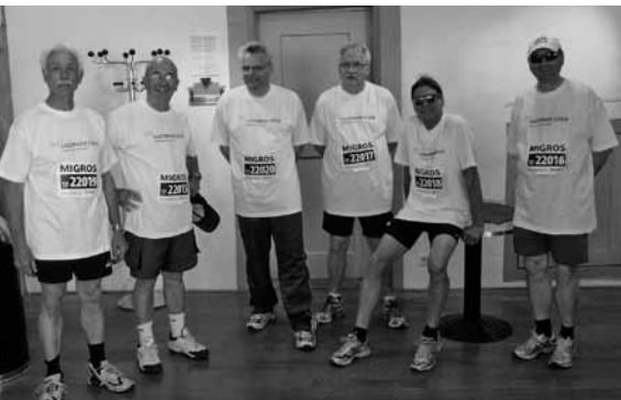
Die sechs Mutigen des Luzerner Chors.