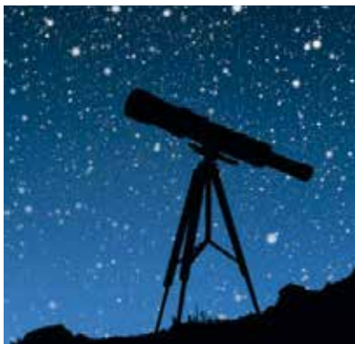
Zum Jahresauftakt wurde in die Sterne geguckt.