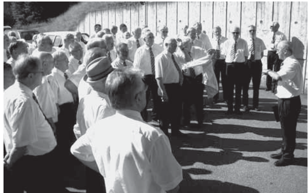
Letzte Instruktionen des Präsidenten.