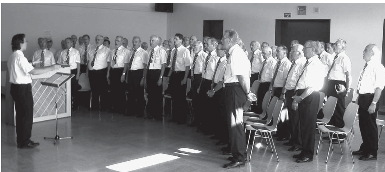
Beim Einsingen vor dem Wettkampfvortrag in Wolhusen.

49. Luzerner Kantonalgesangsfest 2006 can tiam o Wolhusen 30. Juni - 2. Juli 2006