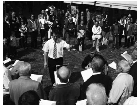
Fortsetzung vor vielen Zuschauern beim Kapellplatz.