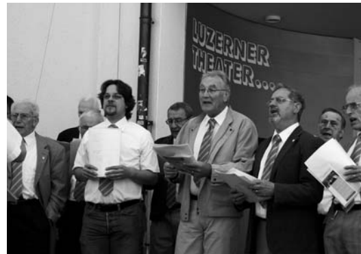
Auch das ehrenwerte Luzerner Theater stand auf dem «Konzertprogramm».