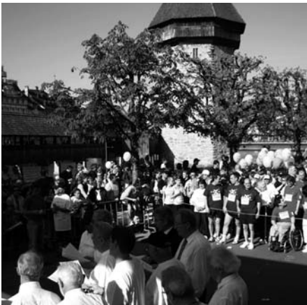
Ein motivierendes Lied vor Tausenden von startbereiten Läufern.