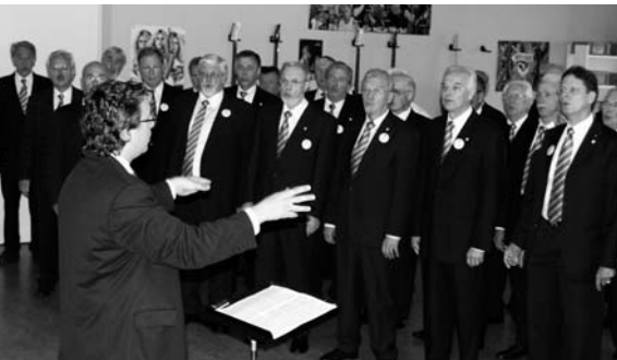
Beim Wettvortrag.

Die Teilnahme am Schweizer Gesangsfest in Weinfelden war für den Luzerner Chor ein Grosse Erfolg. Der Vortrag mit den Liedern «Im Juni» (Josef Gabriel Rheinberger), «S'Seeli» (Othmar Schoeck) und «Nordmännerlied» (Joseph Melchior Galliker) wurde mit einem «Vorzüglich» belohnt.