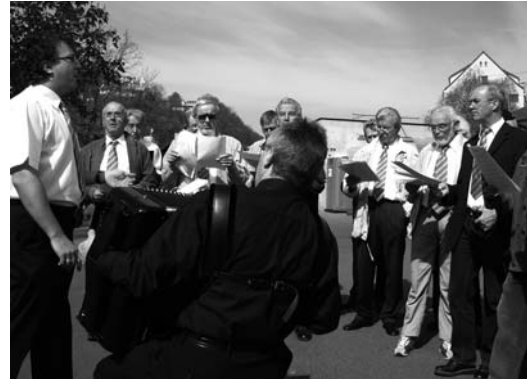
Start der Platzkonzerte beim Muhleplatz.