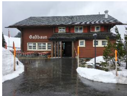
Gasthaus Passhöhe Schwägalp