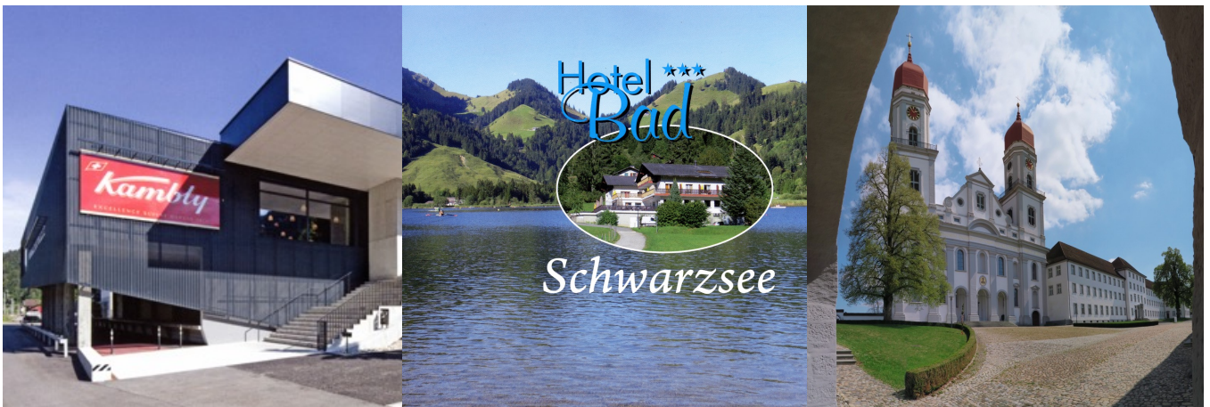
Kambly Erlebnis Trubschachen

Wie üblich sind auch Mitglieder und Angehörige des Luzerner Chores , sowie Gäste herzlich willkommen.