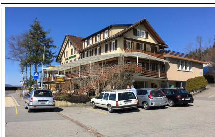
Hotel Eierhals Royal

Nach einem zuerst warmen und dann kalten Winter hoffen wir im Wonnemonat Mai auf richtig frühlingshafte Temperaturen und schönes Wetter. Wir möchten auf einer 5-Seenfahrt wieder einmal die faszinierenden Landschaften im Zentrum des Kantons Schwyz besuchen. Am Ziel der Reise erwartet uns auf einem grossen Landwirtschaftsbetrieb ein währschaftes Mittagessen im Bäsü Beizli . Daneben hat der Bruder des Wirtes eine grosse Sammlung von Kutschen aus vergangenen Jahrhunderten. Sofern die Zeit reicht, werden wir am Nachmittag auf der Rückfahrt nach Luzern noch einen Zwischenhalt in Einsiedeln vornehmen.