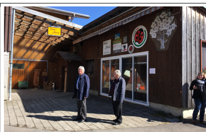
Bäsü Beizli Euthal